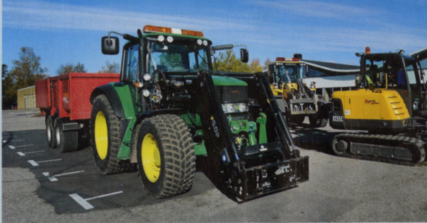
Tre maskiner, John Deere 6630, Volvo EC55C och L70F, vid ett markarbete på en parkeringsplats.