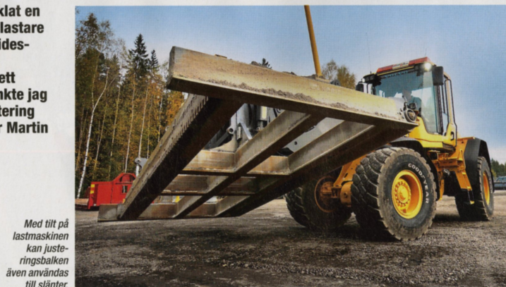
Med tillt på lastmaskinen kan justeringsbalken även användas till slänter.

Lite entreprenörskap i kombination med maskinkunnande blev grunden till en konstruktion som är lätt att transportera, gör jobb som annars skulle kräva en hyvel