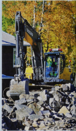
Nostalgimaskinen, en Volvo EL70C från 1996 har renoverats till perfekt skick.